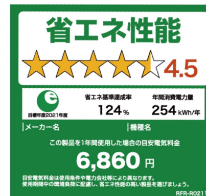
◀ 省エネラベル見本